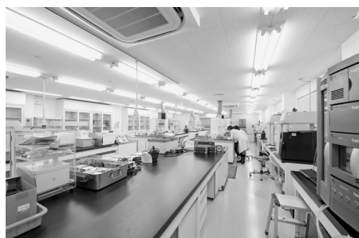
医薬分析センター 2F

州・中国・インドなどのサプライヤーと積極的に連絡を取り、毎年4度、各地域の国際医薬品原料・中間体展に出展し、お客様に文字通り「高品質の医薬品原料を低価格にて安定供給」するべく、最新の情報を入手するよう心がけております。