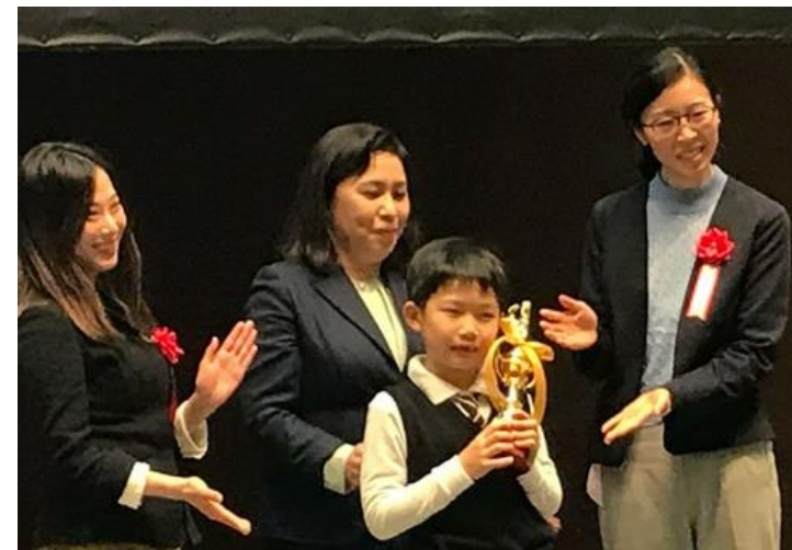
「2022年度全国選抜小学生プログラミング大会」全国大会（2023年3月5日）

当協会の取り組みやジェネリック医薬品の解説などを動画でご覧いただけます。（最新：小学生向けコンテンツ『おくすり大百科～目指せ！おくすり博士～』公開中！）